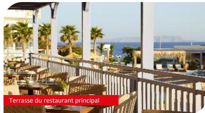
Terrasse du restaurant principal

La formule tout inclus est accessible dès votre arrivée dans l'hôtel, et ce jusqu'à l'heure de votre départ.