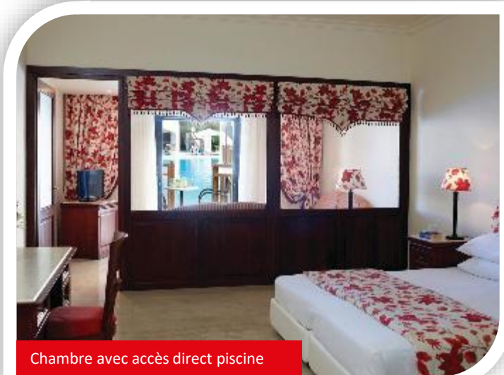
Chambre avec accès direct piscine